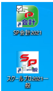
スクールプロのアイコン

異動時期になりました。どこに、どんなデータがあるか、引き継ぎ書にあると助かります。使えるデータの所在を知らずに、新たに入力している新任者を見受けます。簿冊や電子データの保管場所と一緒に、スクールプロの情報（ID、パスワード、マニュアルなど）もお忘れなく！（5年以上更新のない不要ファイルは削除しておきましょう）